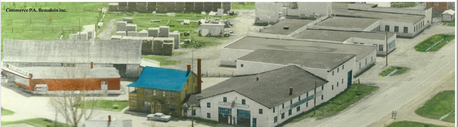
Commerce P.A. Beaudoin inc.

Ce projet a été rendu possible grâce à la contribution de la municipalité et de ses partenaires.