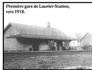
Première gare de Laurier-Station, vers 1918.

Laurier-Station devint le point de convergence du développement économique de la région. Le train était alors le moyen de transport le plus utilisé autant pour les marchandises que pour les passagers de toutes les paroisses avoisinantes.